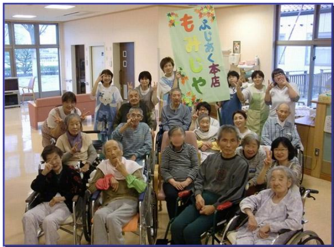
利用者様とユニットスタッフ全員集合

ユニット棟は家庭的な雰囲気の中でゆっくりと時間の流れを感じることができます。スタッフはあたたかい空間で利用者様お一人お一人のケアをやさしい笑顔で対応しております。